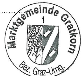
Bürgermeister Helmut Weber